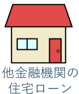
他金融機関の 住宅ローン