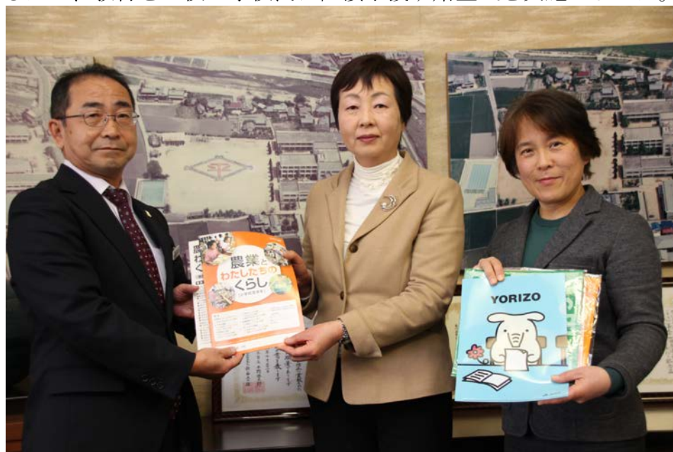
補助教材の贈呈式

令和元年度版補助教材の贈呈については、教材の活用方法について学校の意見に触れるため、教材を3校の学校長に直接手渡す贈呈式を実施しました。